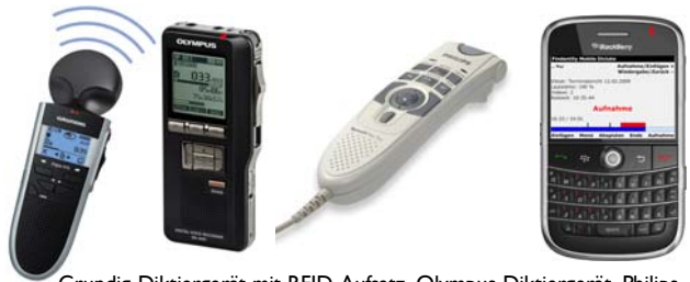
Grundig-Diktiergerät mit RFID-Aufsatz, Olympus-Diktiergerät, Philips-Diktiermikrofon, BlackBerry-Smartphone mit Diktiersoftware von Thax

Die einfache und intuitive Bedienbarkeit folgt aus der Entwicklung in der Praxis. Die zahlreichen positiven Rückmeldungen und Auszeichnungen bestätigen immer wieder die Zuverlässigkeit und die enorme Effizienzsteigerung. Findentity wurde beim Innovationspreis 2007 der Initiative Mittelstand ausgezeichnet. Das System enthält eine Universalchnittstelle zu Krankenhaus-Informationssystemen (KIS).