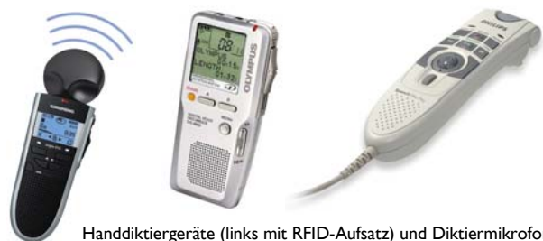
Handdiktiergeräte (links mit RFID-Aufsatz) und Diktiermikrofon

dulare zum Akten- und Dokumentenmanagement erweitert werden. Die Kennzeichnung der Akten mit Transpondern ermöglicht dann z.B. eine Standortanzeige und damit ein schnelles Wiederauffinden im Büro. Findentity ist beim Innovationspreis 2007 der Initiative Mittelstand ausgezeichnet worden und wird neben Gerichten auch in Kanzleien, Krankenhäusern, Banken und anderen Unternehmen sowie seit 2007 vom Regierenden Bürgermeister von Berlin eingesetzt.