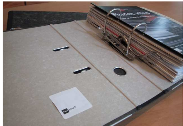
Akte mit RFID-Transponder zur automatischen Aktenerkennung und Zuordnung des eingescannten Dokumentes – optional

Findentity Document verwenden gerne Kunden, die Wert auf eine einfache Bedienung und Integration in das Kundenmanagementsystem (CRM) legen. Bei Verwendung des Zusatzmoduls Workflow können Dokumente mit Aktivitäten verknüpft werden. Findentity Document ermöglicht die Führung einer „Hybridakte“ durch Verbindung von Papier und EDV. Mit der elektronischen Akte, optional mit der RFID-Erkennung der Handakte sowie mit der Volltextsuche besteht sofortiger Zugriff auf alle Dokumente. Zum Einscannen kann jeder Scanner verwendet werden, der die Dokumente in einem Verzeichnis ablegt.