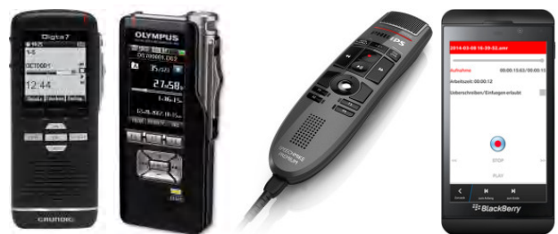
Diktiergeräte von GRUNDIG, OLYMPUS und PHILIPS und optional Smartphone

Optional Einbindung von RFID zur Erkennung der Papierakte und automatischen Diktatzuordnung. Jede Schreibkraft kann via Netzwerk oder mit der Akte auf die Diktate zugreifen.