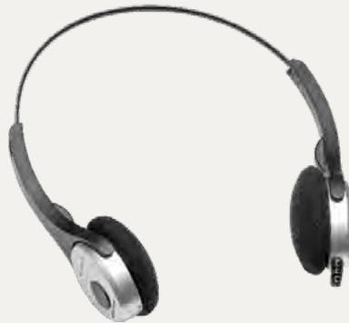
Digta Headphone 565