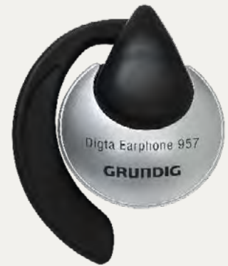
Digta Earphone 957