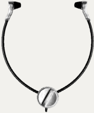
Digta Swingphone 568