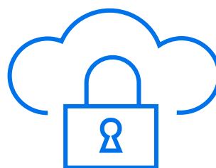
On-Premise oder Hosting-Partner